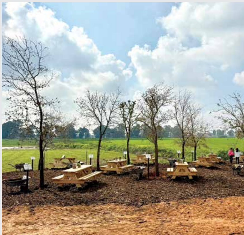
חורשת האלונים בקריית המועצה

בדשא של הקיבוץ או המושב, ברחבי ארץ ישראל שלנו, זרועים אינספור אנדרטאות פיזיות ורוחניות שמזכירות ויזכירו אותם. ובעיקר בלבבות של מאות ואלפי אוהבים ומזוקרי זכרם, בכל מקום. אלו הן אנדרטות נצחיות שיעמדו בגשם ובשמש ולא ישחקו לעולם. החותם שהשאירו בנפשם של רבים כל כך, זו המורשת שלהם!.