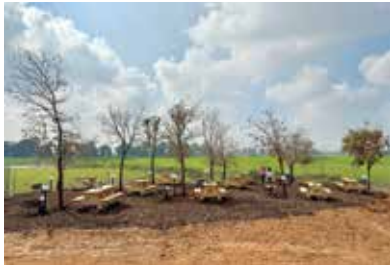
חורשת האלונים בקריית המועצה.