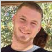
סמל רני תמיר ז"ל מגני עם