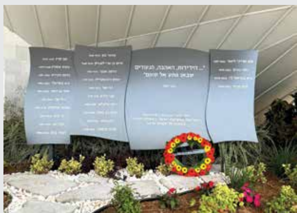
האנדרטה בבית חינוך עמי אסף