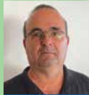
צפיר שחם גני עם