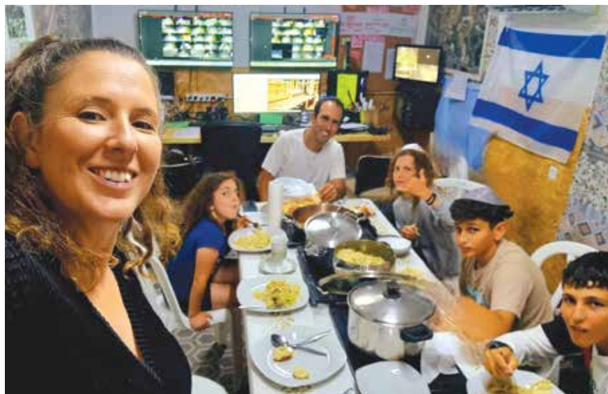
משפחת רווח בארוחת שישי בזמן משמרת בחמ"ל

הקהילה היא הכוח שלנו, אין כמו אנשים שדואגים ותומכים אחד בשני ברגעים הקשים. אנחנו חזקים יותר ביחד. בואו נשמור על זה.