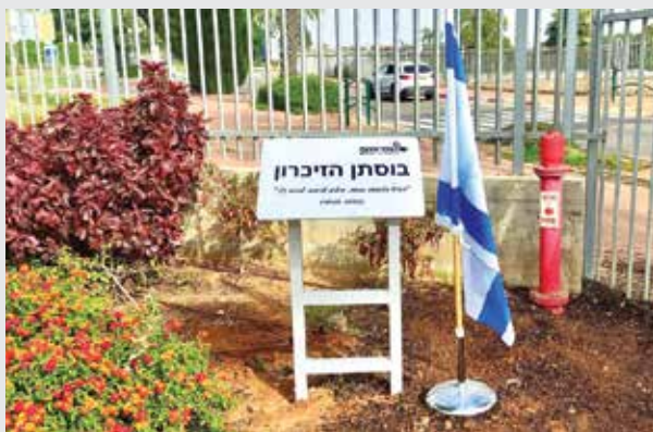
בוסתן הזיכרון בעמי אסף