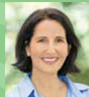
אשרת גני גונן ראש המועצה