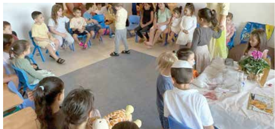
דירה שהפכה לגן ילדים ומתחם טיפולי