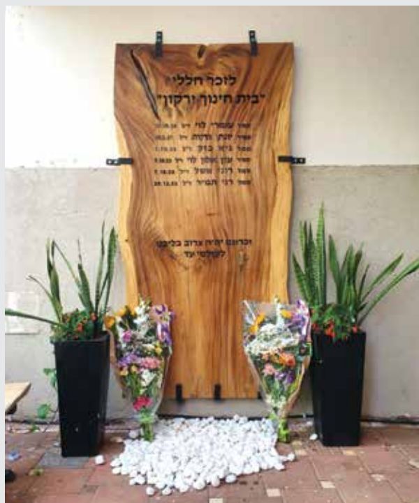
האנדרטה לזכר חללי בית חינוך ירקון