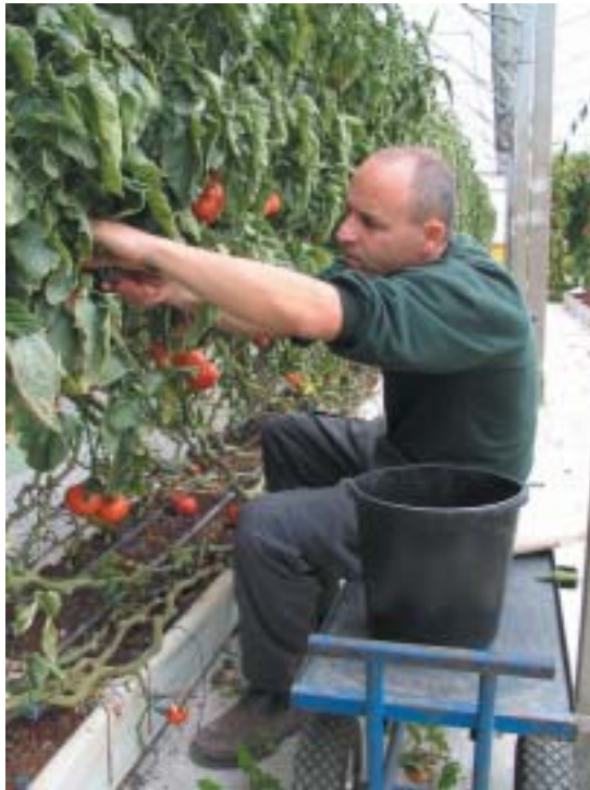
מגדלים עגבניות על מצע מנותק בקיבוץ עינת

למידע נוסף והיערכות לשנת השמיטה, ניתן לפנות לרבני המועצה בטל. 03-9000607.