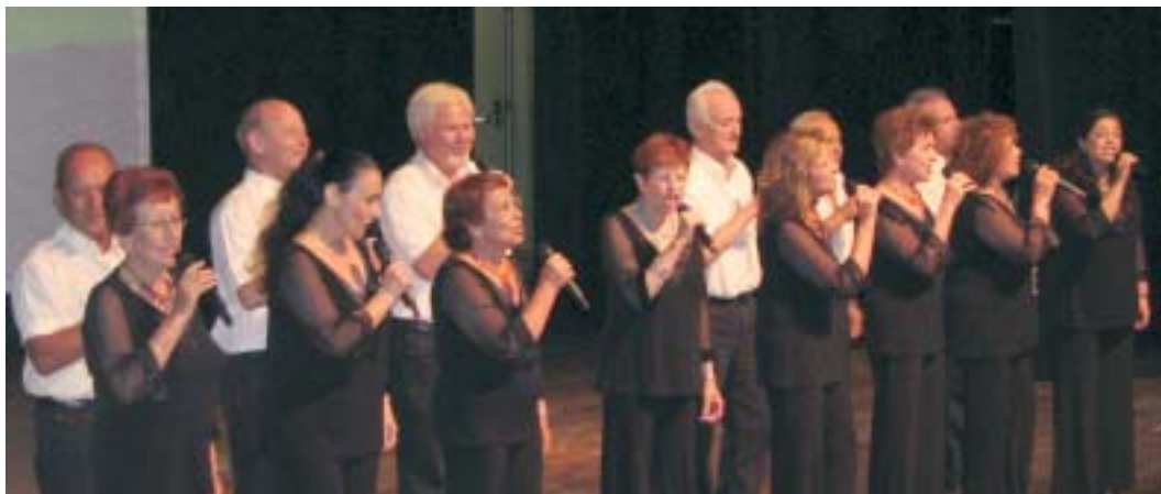
להקת ה"גבעתרון" זוכת פרס ישראל