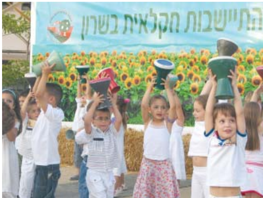
מופע דרבוקות של ילדי הגנים במועצה

הבאה יהיו אלה גבעת חן, כפר סירקין, צופית ורמות השבים, בעוד שנתיים יגיע לגיל המופלג כפר מע"ש ובעוד שלוש שנים יהיה זה גן חיים . שלושה מיישובי המועצה ה"ותיקים" - כפר מל"ל, גת רימון, וגבעת השלושה כבר חגגו 75 שנה להיווסדם, ואילו השאר הינם "צעירים" ונוסדו בין השנים 1949 ועד היום (צור יצחק).