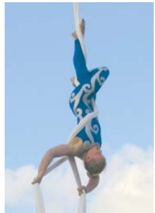
מופע לולינות - קרקס "לפמיליה"