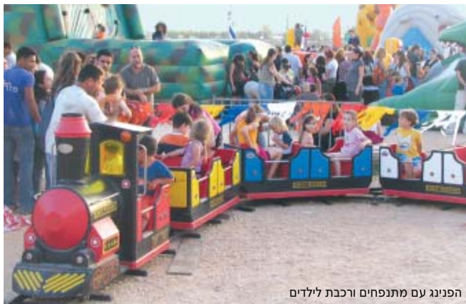
הפנינג עם מתנפחים ורכבת לילדים