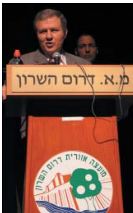
מאיר שטרית, שר השיכון והבינוי ויו"ר מנהל מקרקעי ישראל