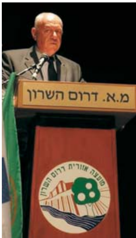
רוני בר-און שר הפנים

המחשה, להקים את טרמינל 3 עלה כ- 3 מליארד ש"ח ואילו התביעות כנגדו של כל מיני אנשים שגרים קילומטרים משם עומד על למעלה מ- 5 מליארד ש"ח". יו"ר מרכז המועצות האזוריות שמואל ריפמן הזהיר כי "אם לא ישונה סעיף 197 לחוק התכנון והבניה ישותקו הועדות והרשויות המקומיות והאזוריות. החוק הנוכחי גורם נזק עצום וזוהי גזירה שאין הציבור יכול לעמוד בה". עדי אלדר הבהיר כי אם לא יתוקן החוק, קיימת סכנה של ממש לקריסתן של ועדות ורשויות מקומיות, היועץ המשפטי של משרד הפנים יהודה זימרת טען בכנס כי רוב תביעות הפיצויים מוגשות על סמך ספקולציות, כלומר נסמכות על ציפיות לגבי הקרקע הנפגעת. זימרת תקף את ההכרה הגורפת בזכות התביעה בגין פגיעה עקיפה דוגמת הסתרי נוף. לחיזוק בלתי צפוי זכו הדוברים דווקא מפיו של שופט בית המשפט המחוזי בתל אביב ד"ר עוזר מודריק. השופט ביקש להזהיר ממתן עדיפות להשקפת העולם המשפטית פוליטית של עקרון הצדק החלוקתי, כלומר להימנע מאיזון כספי אוטומטי בין מי שנפגע בצורה כלשהי מפיתוח נדליני לבין מי שמרוויח מכך.