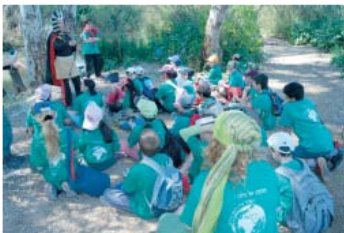
תלמידי הרשת הירוקה באחת מתחנות הפעילות

גלומה התנצלות דור ההורים על העולם שהם משאירים לילדים. בכנס השתתפו ילדים מ-כפר סבא, רעננה, הוד השרון, כוכב יאיר-צור יגאל והמועצה אזורית דרום השרון שהפכו לטור אחד הומוגני של שומרי סביבה כאשר לבשו כולם חולצה אחידה ועליה הכיתוב: הכוכב של כולנו, נשמור עליו למען עתידנו.