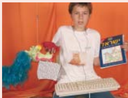
אחד מתוך צילומי התלמידים המוצגים בתערוכה