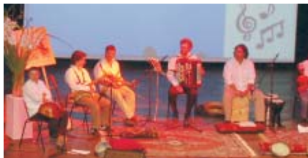
להקת "מזרח ומערב" בקונצרט הסיום

מאות ילדים מכל גני המועצה השתתפו בשני קונצרטים לסיכום שנת הפעילות לחינוך המוסיקאלי בגנים. את הקונצרט העבירו חברי להקת "מזרח ומערב". תוכנית המוסיקה בגני הילדים פועלת על פי הקו המנחה של פיתוח, הבנה ומיומנויות מוסיקאליות בילד, באמצעות השתתפות חוויתית במגוון פעילויות מוסיקליות. התוכנית מבוצעת בשיתוף משרד החינוך ומושתת על עקרונות של הנאה, חויה ויצירה ומטרתה לגדל ולטפח דור של צרכני תרבות.