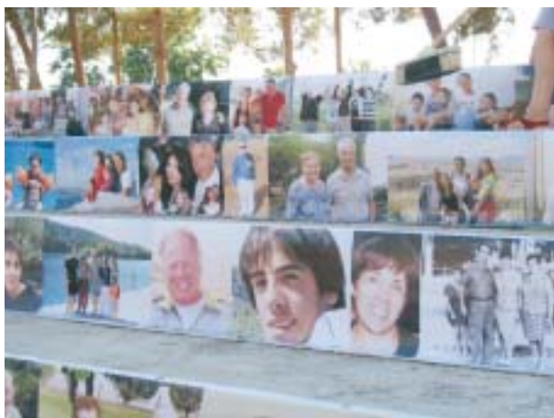
צילום קבוצתי של תושבי המושב