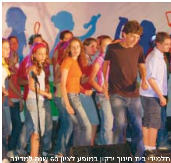
תלמידי בית חינוך ירקון במופע לציון 60 שנה למדינה