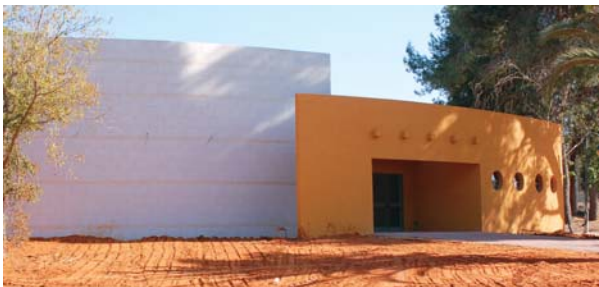
בית העם בשדי חמד

גן ילדים חדש נמצא בשלבי תכנון. בנייתו של בית עם בן כ- 300 מ"ר, נמצאת בשלבי סיום.