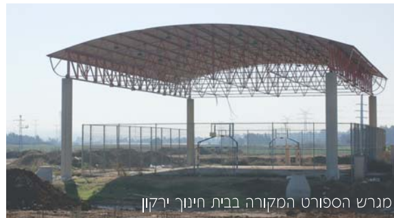
מגרש הספורט המקורה בבית חינוך ירקון

החלה בניית שלב ד' בבית חינוך ירקון. הבנייה עתידה להסתיים לקראת פתיחת שנת הלימודים הבאה. במסגרת הבנייה יגדל בית הספר ב-1700 מטרים נוספים. עם השלמת עבודות הבנייה של שלב ד', יסתיים הליך הקמתו של בית הספר.