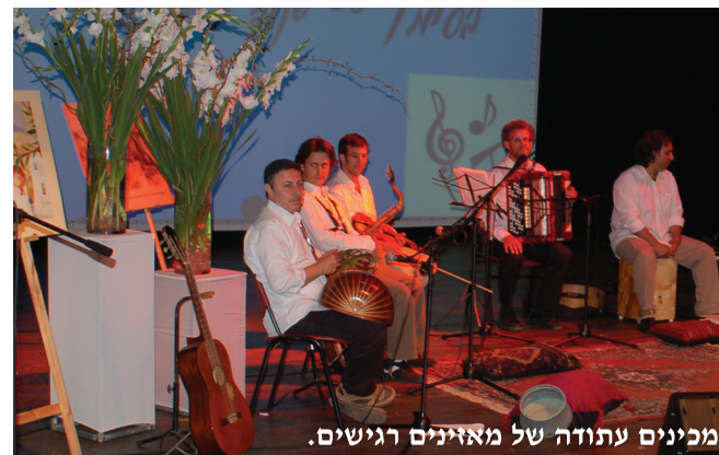
מכינים עתודה של מאזינים רגישים.

התוכנית תופעל בחמשת בתי הספר היסודיים: יחדיו, מתן, מעבר אפק, צופית ואהרונוביץ . בית הספר לאומנויות כצלסון , ימשיך בפעילותו המוסיקלית עם התזמורת הפילהרמונית.