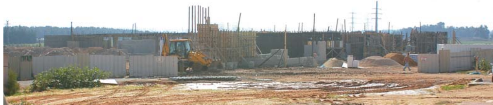
בית הספר היסודי בבנייה

עבודות הבנייה של בית ספר יסודי חדש בן 24 כיתות נמצאות בימים אלה בעיצומן. בית הספר החדש, נבנה בקרית המועצה בסמוך לבית חינוך "ירקון" וישמש את תלמידי בית הספר "אהרונוביץ". העבודות מתבצעות בהתאם לתכנון חדשני המקנה בידוד מקסימלי לכל כיתה. בית הספר יכלול 3 "זרועות" שיצאו מבניין מרכזי ובו חדרי הנהלה, מוזכירות, ספרייה, חדר מחשבים, חדרי מורים וספח. בכל זרוע 2 קומות, בהן יבנו ארבע כיתות בכל קומה. לכל כיתה יציאה ישירה לחצר בקומה הראשונה ומסדרון פנימי המחבר אל הבניין המרכזי בקומה השניה. בית הספר תוכנן על ידי "נופר אדריכלים", ובנייתו עתידה להסתיים בנובמבר 2009.