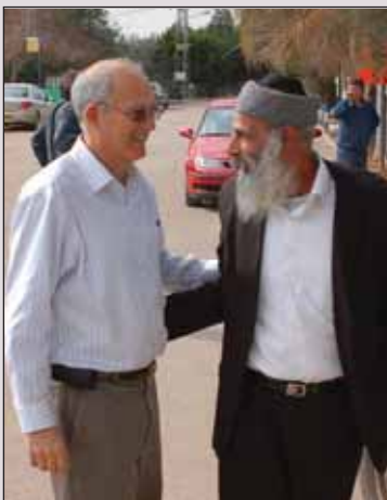
המשך בעמוד 15

כבעבר, חמשיך המועצה להאציל חלק מסמכויותיה לועדים המקומיים. בעיקר בתחומים בהם יש לוועד המקומי יכולת להשפיע על איכות החיים ואופיו של היישוב.