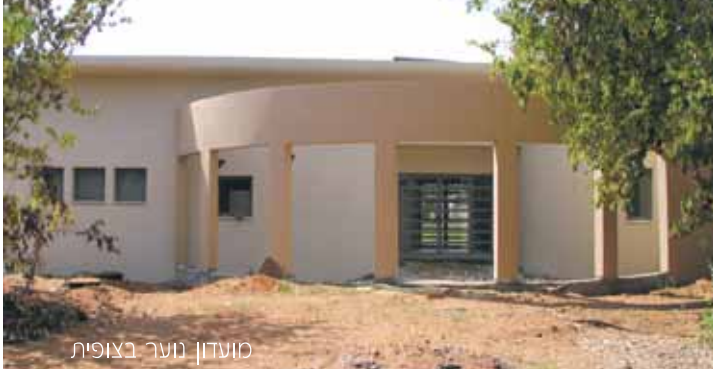
מועדון נוער בצופית

בחמש השנים האחרונות נחנכו במועצה מועדוני נוער בחגור, עדנים, כפר מעש, נוה ימין, ירקונה, צופית, ירקונה, גבעת ח'ין, מתן, צור יצחק. מכרז להקמת מועדון נוער ברמות השבים הסתיים לאחרונה, ובקרוב תחל בניית המועדון.