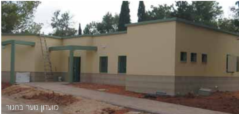
מועדון נוער בחגור