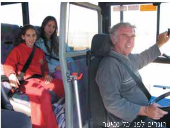
חוגרים לפני כל נסיעה

במקביל לפעילות החינוכית הרבה מקפידים במועצה על בטיחות התלמידים בדרך אל מוסדות החינוך. בכל האוטובוסים במועצה מותקנים חגורות בטיחות והתלמידים מחויבים להחגר לפני הנסיעה. כמו כן בכל האוטובוסים מותקנים פנסי איתות מהבהבים שנועדו להתריע על הימצאות ילדים בסביבה ולמנוע פגיעה אפשרית בהם.