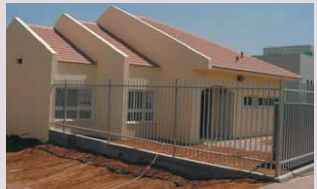
גן חדש בצופית - גן הדר