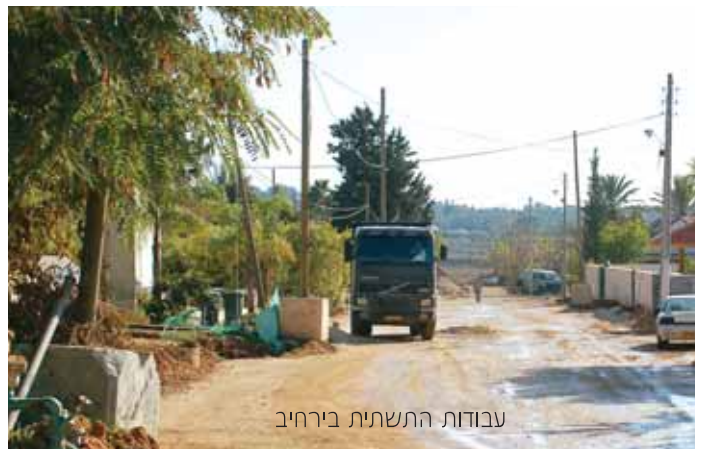
עבודות התשתית בירחיב