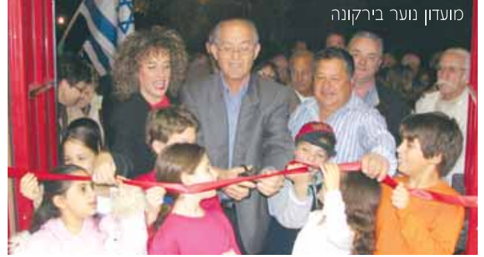
מועדון נוער בירקונה