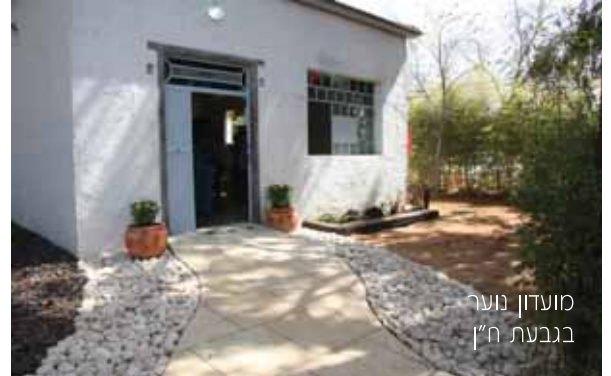
מועדון נוער בגבעת ח'ין