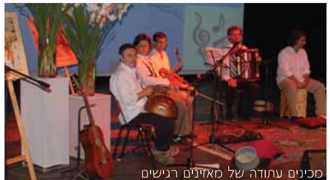
מכינים עתודה של מאזינים רגישים

בבתי הספר היסודיים של המועצה פועלת בשנים האחרונות, התוכנית המוסיקלית חינוכית "פעמה - מפגשים עם מוסיקה חיה". התוכנית מיועדת לתלמידי כיתות א'-ג' מהווה תוכנית המשך לתוכנית המוסיקלית הנלמדת בגני המועצה. במסגרת התוכנית נחשפים התלמידים למפגשים של מוסיקה חיה עם נגנים מתזמורת "סימפונט רעננה", ולומדים במסגרת שיעורי המוסיקה את רפרטואר היצירות של התזמורת. מטרת התוכנית להכין עתודה של מאזינים רגישים וחובבי מוסיקה, ולחשוף בפני התלמידים את היתרונות השונים הטמונים במוסיקה.