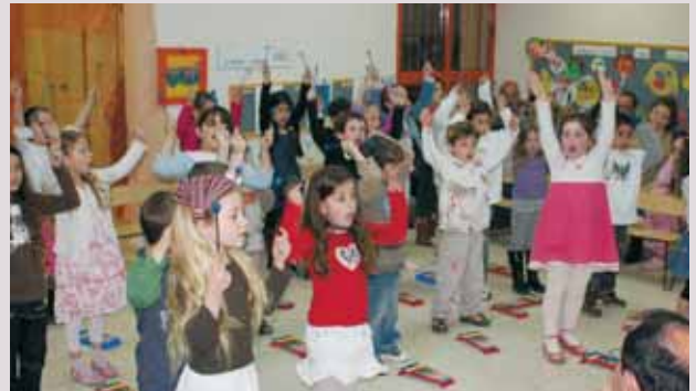
גן חדש בשדי חמד

בחמש השנים האחרונות הקימה המועצה גני ילדים בישובים: צופית, מגשימים, ירקונה, עדנים, גן חיים, שדי חמד, אלישמע, שדה ורבורג, נוה ירק, חגור.