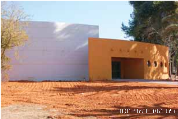
בית העם בשדי חמד

בנייתו של בית העם בשדה חמד, שיבוא במקומו של בית העם הישן, עומדת בפני סיום. גודלו של בית העם החדש הוא כ-250 מ"ר.