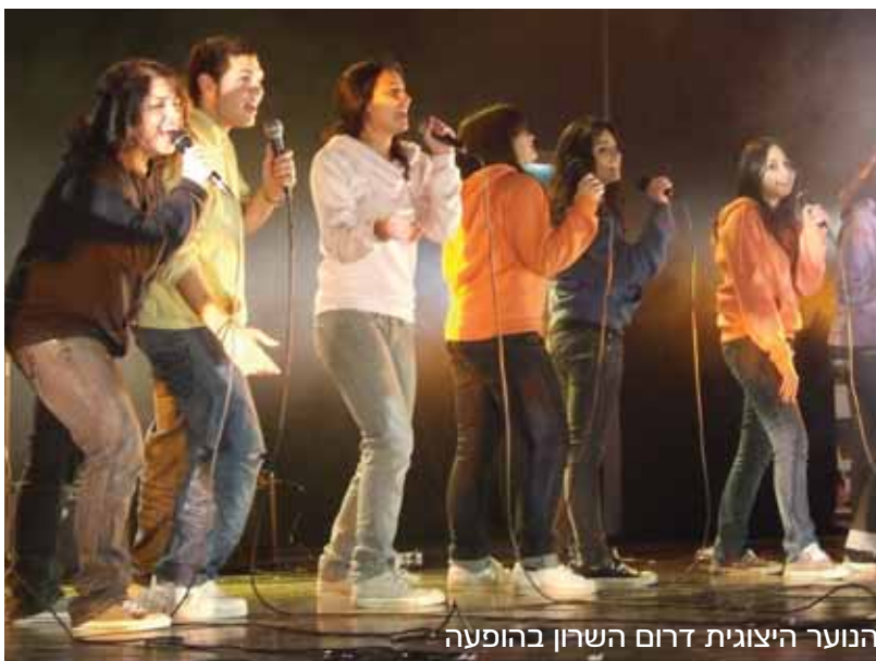
הנוער הייצוגית דרום השרון בהופעה