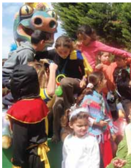
עדלאידע בשדי חמד

חג הפורים צוין בארועים לכל המשפחה שהתקיימו ביישובי המועצה. הילדים והוריהם נהנו משלל פעילויות שהוכנו עבורם ע"י ועדות התרבות הישוביות. הפעילויות כללו תהלוכת תחפושות, מופעי רחוב ומסיבות.