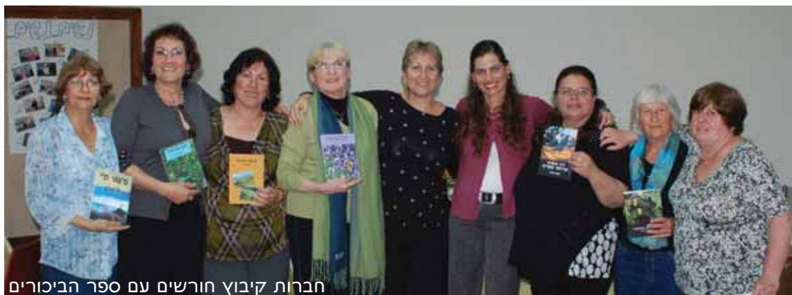
חברות קיבוץ חורשים עם ספר הביכורים

לאחר עבודה קשה בת שנתיים, הסתיים בקיבוץ חורשים פרויקט "סיפורי חיים" בו נטלו חלק תשע מותיקות הקיבוץ. בערב מרגש שהתקיים במעמד מנהלת מחלקת הרווחה יהודית טל ובני המשפחה, קיבלו שבע מנשות הקבוצה את סיפור חייהן כרוך בספר אישי, עליו עבדו מזה תקופה ארוכה. תחילת העבודה לפני כשנתיים אז נוסדה הקבוצה במטרה לעבוד על יחסים בין אישים בין נשות הקיבוץ שהתרחקו מעט בשנים האחרונות עקב שינויים ארגוניים שעבר הקיבוץ.