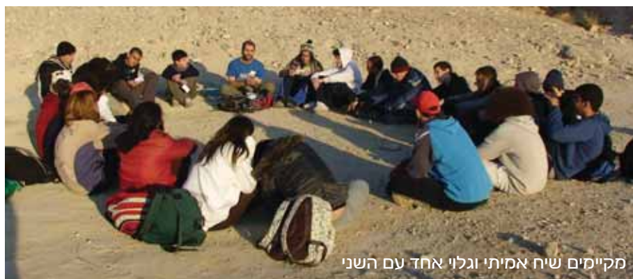
מקיימים שיח אמיתי וגלוי אחד עם השני

ובאהבה גדולה. בתום ההתנדבות קיבלו התלמידים משימות ניווט שמטרתן היכרות עם המקום ועם האוכלוסייה המקומית בדימונה. ימי המסע האחרונים התקיימו בירושלים ושמו דגש על המחויבות למדינה, לעם ולמסורת היהודית. חוויות המסע סוכמו בערב משותף של הורים, תלמידים, מורים ומדריכים שנתן טעימה חווייתית ומושג על ההתרחשויות במסע עצמו.