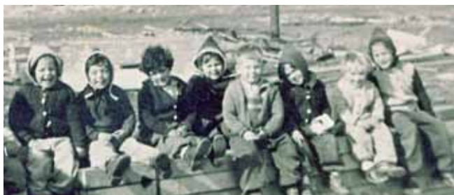
פעם היה כאן קר...