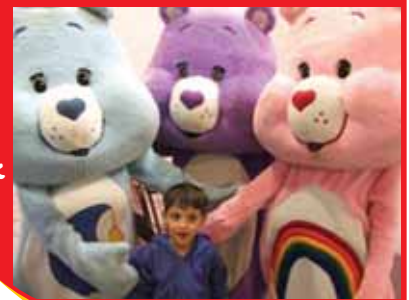
דובוני איכפת לי

מוזיקה של סרגי פרוקופייב וק. סן סאנס. יום רביעי, 7 באוקטובר בשעה 17:30 רקדני להקת המחול הקיבוצית הצעירה במופע המשלב מחול, סיפור בחרוזים ומוזיקה.