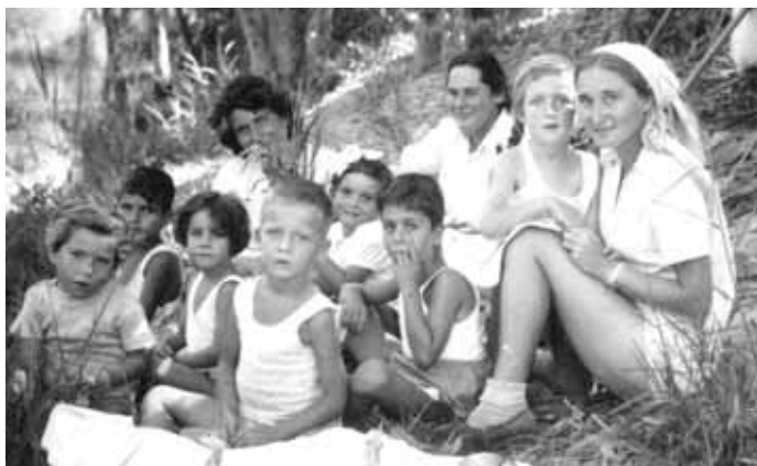
הילדים הראשונים של הקיבוץ