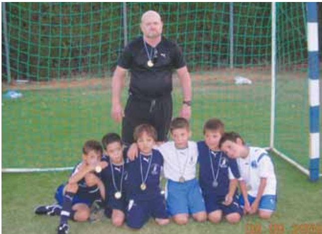
שחקני כיתות א'-ב' מנוה ימין עם המדליות

בטורניר קט רגל לכיתות א'-ב' שערך מדור הספורט של המועצה במושב אלישמע זכו במקום הראשון ילדי מושב נוה ימין . למקום השני הגיעו ילדי מושב חגור ובמקום השלישי זכו ילדי מושב אלישמע . בטורניר לכיתות ג'-ד' זכו ילדי נוה ימין במקום הראשון, אלישמע במקום השני וילדי קיבוץ עינת במקום השלישי.