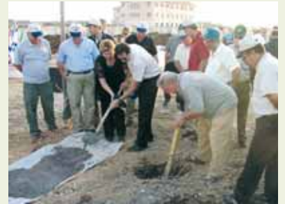
הנחת אבן הפינה לבית חינוך ירקון - 2004

השלימה המועצה את בניית המתחם הכולל 5300 מ"ר בנוי בארבע מבנים ובהם כתות לימוד, מעבדות מתקדמות לכימיה ופיסיקה, כיתות מחשב, ספרייה, אולם ספורט אזורי, מגרש ספורט מקורה, חדרי מוזיקה ומזנון שהוקם השנה לרווחת התלמידים.