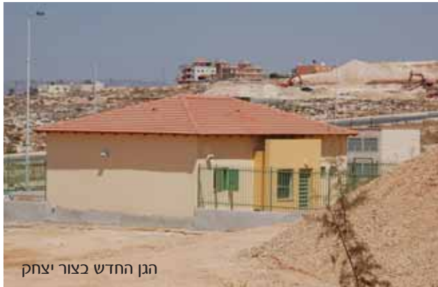
הגן החדש בצור יצחק