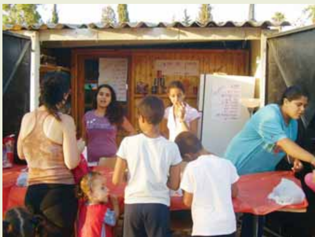
יזמות נוער - הקיוסק בירחיב

במושב ירחיב מבקשים להודות לצוות ההדרכה שפעל לאורך כל השנה במסירות רבה: שני אברהם, מאי עמר, מור דלה, דולב דוכן, בת-אל גולי, שלו דלה, עופרי עשירי ואורי אברהם, ולקדם בברכת ברכה את המד"ציות החדשות המצטרפות לצוות: יהל שרעבי, יובל אברהם, דניאל אהרון וגילי סיבליה.