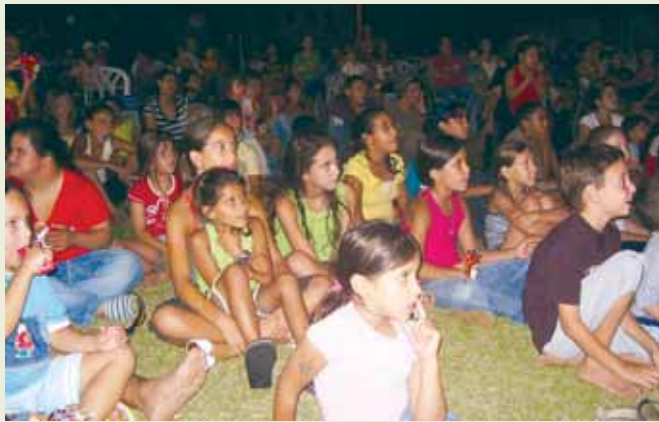
על הדשא, צופים בהקרת סרט