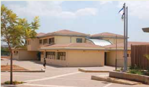
האגף החדש בבית החינוך - 2009

לקראת פתיחת שנת הלימודים התשי"ע הסתיימה בנייתו של שלב ג' והאחרון בבית חינוך ירקון. לראשונה מאז הקמתו השלים בית החינוך את איכלוסו כבית חינוך אזורי שש שנת. בשנת הלימודים הנוכחית לומדים בבית החינוך 743 תלמידים בשש שכבות גיל מכיתות ז' ועד י"ב ומחזור י"ב יהיה למחזור הבוגרים הראשון של בית החינוך. בחודש ספטמבר 2004 התקיים טכס הנחת אבן הפינה לבית חינוך ירקון ומאז כאמור