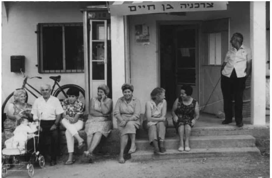
משחזרים תמונה בת 70

בט"ו בשבט התקיים במושב המשחק 'חפש את המטמון', בעקבות אתרים ואירועים מההיסטוריה המקומית ובהשתתפות מאות תושבים. המשפחות חולקו לעשר קבוצות, קיבלו לידיהם כתב חידה ויצאו לגלות חמש מתוך 17 תחנות של אתרים/אירועים שהוכנו מבעוד מועד על ידי צוות המשחק. בתום המשחק התכנסו החברים במועדון התרבות וקיבלו את 'המטמון' - חוברת המספרת את