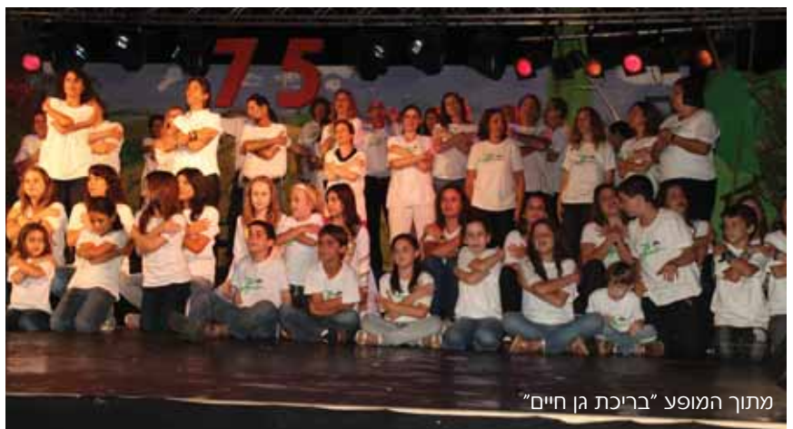
מתוך המופע "בריכת גן חיים"