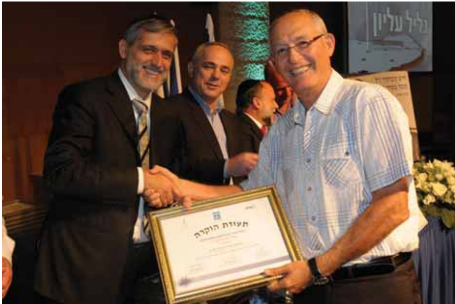
בתמונה (מימין לשמאל): ד"ר מוטי דלג'ו ראש המועצה, דר' יובל שטייניץ - שר האוצר ואלי ישי - שר הפנים

המועצה ד"ר מוטי דלג'ו בטקס שהתקיים בירושלים, במעמד שרי האוצר והפנים.