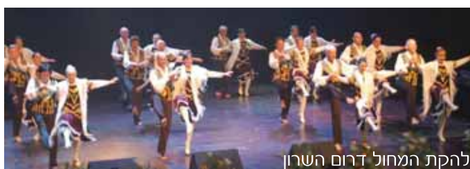
להקת המחול דרום השרון