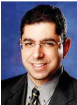
יום חמישי, 7.6.12, בשעה 20:30 בית העם נירית

נושא ההרצאה: ההרצאה כוללת תפיסה רחבה של המזרח התיכון, ניתוח מגמות, הצגת "כללי משחק" של המזרח התיכון, סיפורים פיקטיביים בשילוב הומור מהעולם הערבי.