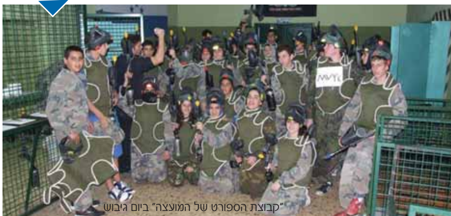
"קבוצת הספורט של המועצה" ביום גיבוש

מדור הספורט במועצה יזם השנה פרויקט חדש וחינוכי בבתי הספר היסודיים - פרויקט ימי ספורט. את ימי הספורט, המתקיימים בימי שישי בבתי הספר, מעבירה קבוצה בת כ-32 נערים מבתי הספר עמי אסף ובית חינוך ירקון המהווה את "קבוצת הספורט של המועצה". בתום הפעילות מקבלים התלמידים תעודות השתתפות.