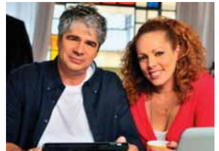
יום חמישי, 3.5.12, בשעה 20:30 בית העם רמות השבים

נושא ההרצאה: דרך דוגמאות מעולם המאבקים החברתיים מביא המפגש עם הקהל את ההבנה על מקומו ותפקידו של הפרט בחברה ואת היכולת והכלים שיש לכל אחד מאיתנו לעשות שינוי.