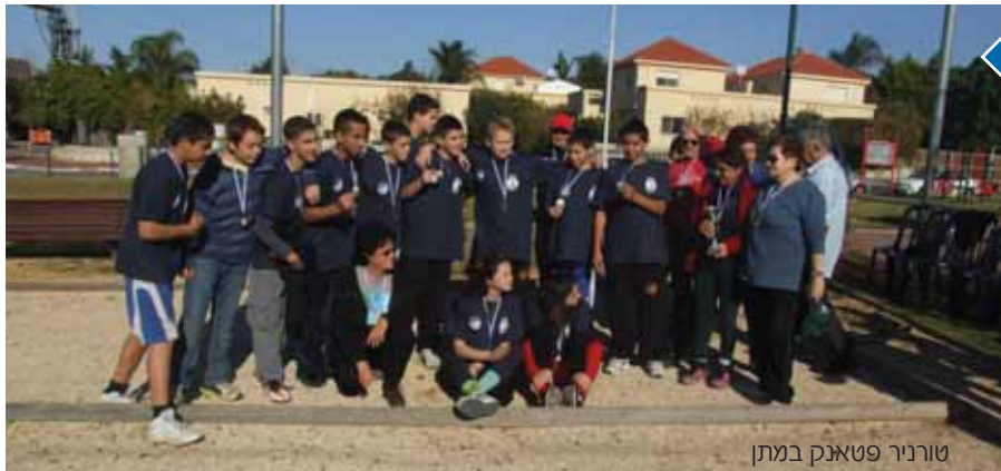
טורניר פטאנק במתן