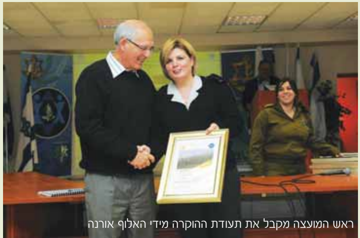
ראש המועצה מקבל את תעודת ההוקרה מידי האלוף אורנה