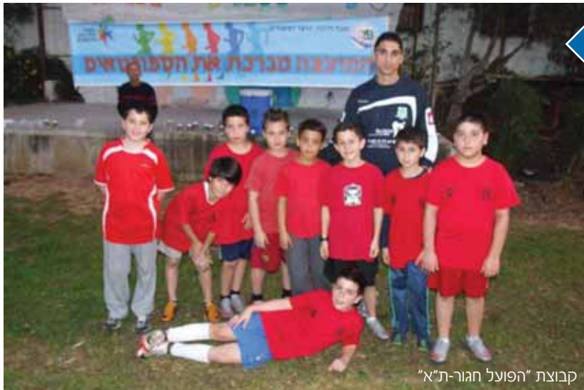
קבוצת "הפועל חגורת-א"

ישובים המעוניינים לקחת חלק במשחקי הליגה מוזמנים ליצור קשר עם ששי דניאל רכז מדור ספורט במועצה האזורית דרום השרון בטל. 03-9000544.