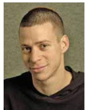
יום חמישי, 10.5.12, בשעה 20:30 בית העם כפר מעש

נושא ההרצאה: הרצאה משעשעת ומרתקת על כל מה שלא ידעתם ואף אחד גם לא טרח לספר לכם.