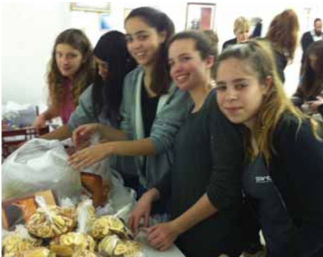
העשרה חינוכית ותרבותית לתלמידי עמי אסף

תלמידי כיתה ט' בחרו לצאת לפעילות התנדבותית בבית התמחוי "אשל בכפר" בכפר סבא. התלמידים שהגיעו למקום בלווית מורותיהם והורים מתנדבים הסתערו במרץ ולא בחלו בשום עבודה: הם סחבו ארגזים, ניקו מקררים, בישלו וארזו קופסאות מזון לחלוקה וחבילות שי מלאות בפירות יבשים לכבוד ט"ו בשבט. התלמידים יחד עם המבוגרים עבדו במלוא המרץ, במסירות וברצון והצליחו למלא את המקום בניחוחות טובים של אוכל חם מלא באהבה.