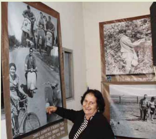
תיעוד תקופת הקמת המושב והשנים הראשונות

במושב אלישמע נערך השנה פרויקט המתעד את תקופת הקמת המושב. הפרויקט הקרוי פרויקט חותם, עוסק בשנים הראשונות להקמת היישוב בדגש על ההווי המקומי באותה התקופה, חיי המשפחה והעבודה, אירועי תרבות ופולקלור, תאור של אתרים שונים במושב, מבנים ראשונים וכו'.