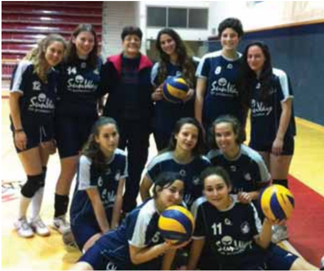
נבחרת הבנות בכדורעף של תיכון "ירקון"

נבחרת הבנות בכדורעף של תיכון "ירקון" עשתה היסטוריה ועלתה לליגת העל של בתי הספר. זו פעם שנייה שהנבחרת זוכה במקום הראשון בגמר המחוזי ועולה לבית הגמר הארצי ומגיעה לחצי הגמר הארצי. במשחק ארוך ומרתק ניצחו בנות ירקון את שער הנגב, קבוצת תחתית בליגת התיכונים, במערכת זהב ועלו לליגת על.