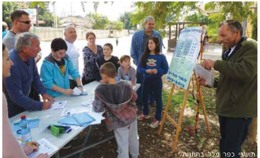
תושבי כפר מל"ל בתחנות

במסגרת אירועי המאה לכפר מל"ל, חגגו התושבים את יום המשפחה במשחק המרוץ ל-100, משחק משפחתי שמטרתו להכיר את עברו של המושב במהלך המשחק עברו המשפחות בתחנות שונות, בהן נחשפו לאירועים מחיי המושב בעבר, מקורות פרנסה אז והיום, חיי התושבים, משמעות שם הכפר ועוד. האירוע נפתח במפגש חגיגי בו הושמעו שירים שנכתבו במיוחד לכפר בן ה-100. באירוע גם הוצג הלוגו שנבחר ללוות את אירועי שנת ה-100 מתוך הצעות שונות שהוגשו ע"י התושבים.