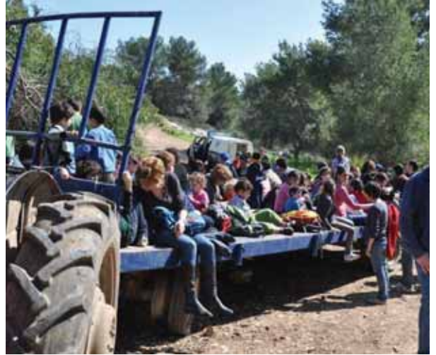
בתמונה: ילדי צור נתן על העגלה

הפריחה הייתה בשיאה, כלניות רקפות ופרחים בשלל צבעים. את חלקו האחרון של המסלול עשו הילדים והוריהם על עגלה וטרקטור. לסיום חיכתה לכולם ארוחת צהריים חמה וטעימה.