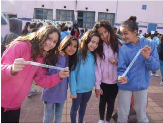
מכול, להיות בני אדם לפני כל דבר אחר בחיים ושאלומות מובילה אותנו לאבדון.