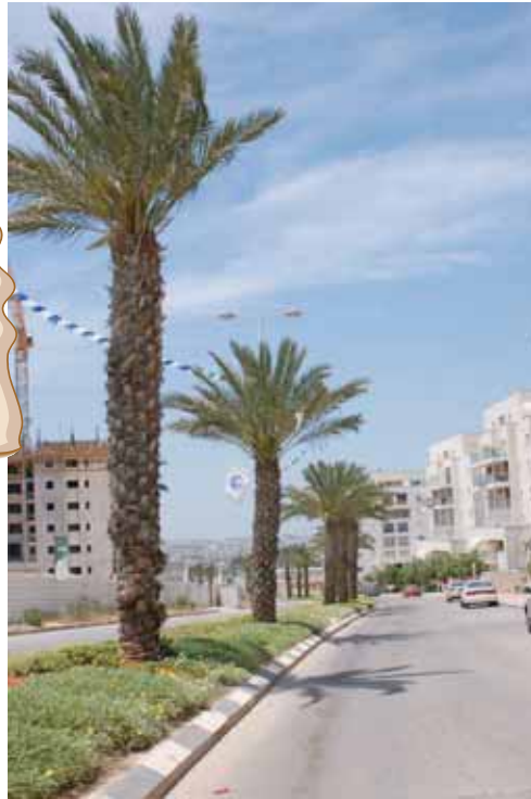
צור יצחק היום

מקור השם - ע"ש ראש הממשלה המנוח יצחק רבין הנחת אבן פינה - 9.9.2005 גודל - 610 דונם מספר משפחות מתוכנן - 2500 מספר משפחות המתגוררות בישוב - כ-800