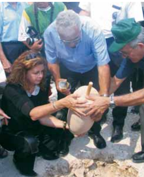
יו"ר הוועד המנהל של מרכז רבין דליה רבין וראש המועצה האזורית ד"ר מוטי דלג'ו מניחים את אבן הפינה לישוב, 9.9.2005.

לאור החלטת הממשלה תפעל המועצה האזורית דרום השרון למינוי ועד מקומי ממונה מקרב תושבי הישוב שיכהן עד למועד הבחירות בסוף שנת 2013.