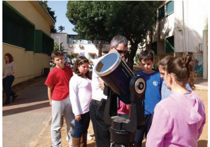
לומדים אסטרונומיה ביום ההורה

הורי התלמידים בבית חינוך צופית תפסו ליום אחד את מקומו של צוות ההוראה והעשירו את עולמם של הילדים בהרצאות במגוון גדול של נושאים מתחומי ההתמחות שלהם.