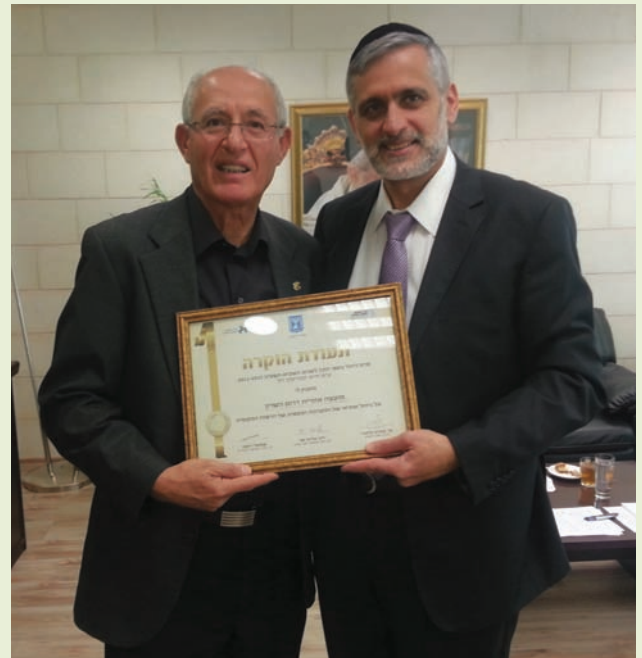
שר הפנים אלי ישי מעניק את תעודת ההוקרה לד"ר מוטי דלג'ו

פרס הניהול הכספי התקין ברשויות המקומיות ניתן למועצה על ניהול אחראי של המערכת הכספית והמנהלית, שמירה על יציבות פיננסית, עמידה בהתחייבויות הכלולות במסגרת התקציב, והתנהלות אחראית בניהול המערכת הכספית והתקציבית. עוד נבחנים מדדי יעילות תקציבית, ניהול ארגוני תקין שכולל בין השאר, ניהול שכר וכ"א, ניהול מערך השירותים, אכיפה בנושא בניה בלתי חוקית וכן התייחסות לחובות נבחרים.