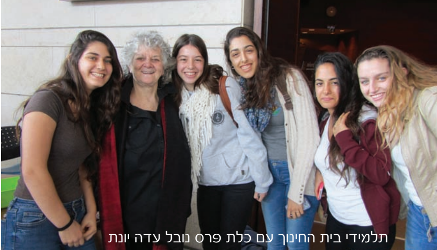
תלמידי בית החינוך עם כלת פרס נובל עדה יונת

במסגרת סיורי המגמות והמקצועות המורחבים הנערכים בבית חינוך "ירקון" יצאו 80 תלמידי מגמת הכימיה בכיתות י"ב לסיור במכון ויצמן שברחובות. במסגרת הסיור, שמעו התלמידים הרצאה מודגמת על ניפוח זכוכית, והתרשמו מתכונותיו המיוחדות והייחודיות של חומר נפוץ זה. הם סיירו בכמה ממעבדות המחקר שבמכון, שמעו על המחקרים והתרשמו מעבודת החוקרים, מהציוד ומהכלים המדעיים בהם נעשה שימוש, במסגרת מחקרים שונים בתחום הכימיה, הביולוגיה והפיזיקה.