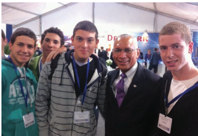
תלמידי עמיאסף עם ראש נאס"א - צ'ארלס בולדן.

תלמידי שכבת י"א הלומדים במגמת פיזיקה ובעתודה המדעית טכנולוגית יצאו לכנס החלל הבינלאומי שהתקיים בבית חיל האוויר בהרצליה.