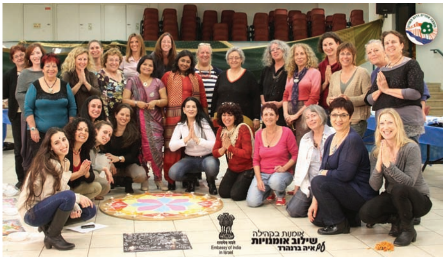
תושבות המועצה משתתפות התערוכה "נשים צבע במעגל"