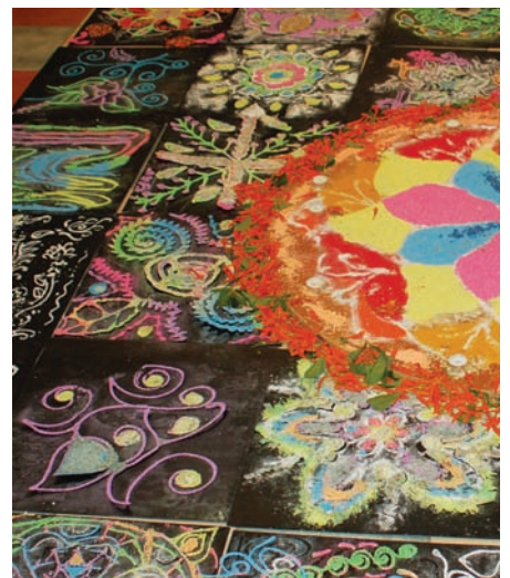
אחד מציורי הרנגולי