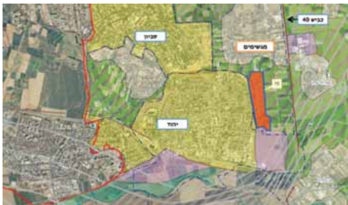
מתחם יהוד, מגשימים