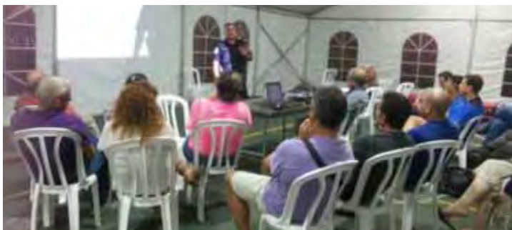
הכשרה של סיירת הורים צור יצחק

סיירת ההורים במועצה צברו תאוצה רבה במהלך הקיץ האחרון כשארבע סיירות הורים פעלו בארבע יישובים - צור יצחק, שדי חמד, מתן ואלישמע. סיירת הורים יישובית פועלת בשיתוף היחידה למניעת התנהגויות סיכוניות במועצה. הפעילות מתבצעת לרוב בשעות הלילה ובסופי שבוע, על פי צרכי היישוב וזמינות ההורים המתנדבים. הפעילות כוללת סיורים במוקדי בילוי של בני הנוער כגינות ציבוריות, פארקים, זולות חשוכות ועוד. ההורים עוברים הכשרות שוטפות מטעם עיר ללא אלימות ובשיתוף הרשות למלחמה בסמים ואלכוהול במועצה, לומדים על השפעות האלכוהול והסמים, איתור בני נוער בסיכון ואינטראקציה עם בני הנוער ומקבלים כלים להתמודד עם תופעות שונות בהן ייתקלו במהלך פעילות הסיירת. לסיירת מספר גרסאות ודרכי פעולה ובהן סיירת אופניים כדוגמת הסיירת הפועלת בשדי חמד וסיירת רגלית בשאר היישובים. יישובים נוספים המעוניינים להקים סיירת הורים מוזמנים לפנות ליחידה למניעת התנהגויות סיכוניות בטל. 03-9000646.