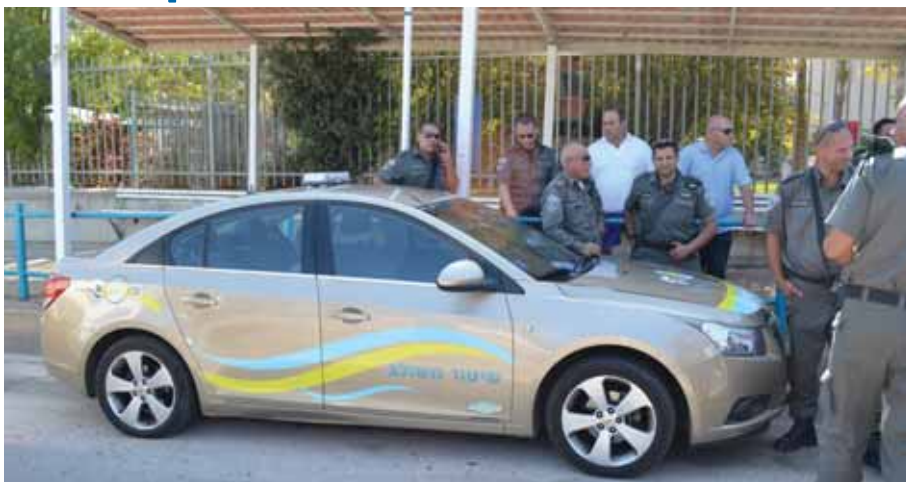
ניידת שיטור משולב

בחודש יולי החלה לפעול ביישובים ניידת שיטור משולב של המועצה בשיתוף תכנית "עיר ללא אלימות" של המשרד לבטחון פנים. הניידת מסיירת במוקדים שאותרו ומופו מראש, תוך דגש על אזורים בהם לא הותקנו מצלמות ולא מתבצעות פעולות אכיפה אחרות. המטרה היא לאתר ולמנוע תופעות של אלימות וונדליזם מתוך הבנה שנוכחות שוטר בניידת מגבירה את סמכויות האכיפה.