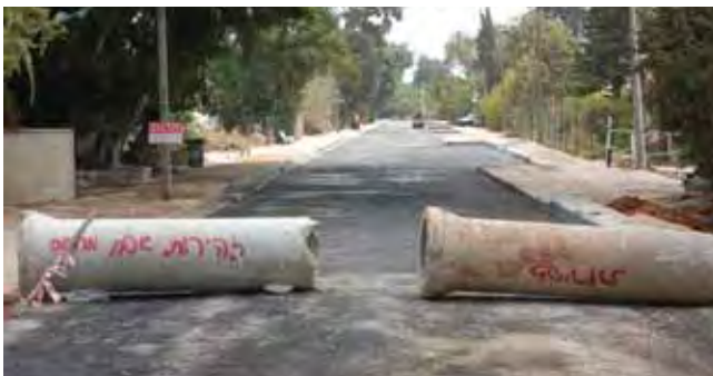
למעלה: שיפוץ בית הנוער בנווה ימין, למטה: עבודות ריבוד כבישים בכפר סירקין, מימין: שדרה מגרש כדורסל באלישמע