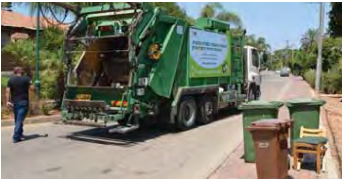
פעילות הטמעת הפרדת אשפה בישובים ובבתי הספר

במרץ 2013 החל לפעול פיילוט מועצתי להפרדת פסולת לשני זרמים, כלומר, הפרדת הפסולת האורגנית בבתי התושבים והעברתה מופרדת לאתר קומפוסטציה. את המהלך מובילה מחלקת תברואה ואיכות הסביבה כחלק מהשאיפה של המועצה לניהול יעיל, חסכוני וסביבתי. ואכן להפרדת הפסולת האורגנית תרומה משמעותית לאיכות הסביבה. פסולת אורגנית שהופרדה במקור (בבתים) מגיעה לאתר הקומפוסטציה כשהיא נקייה מחומרים רעילים, היא איכותית ומשמשת לטיוב הקרקע. לעומת זאת פסולת אורגנית שלא הופרדה מגיעה לאתרי הטמנה ומייצרת זיהום סביבתי כבד (זיהום קרקע, זיהום מי תהום, מפגעי ריחות ופליטת גזי חממה). המהלך החל כפיילוט בשלושה ישובים: נוה ירק, אלישמע וגני עם . במסגרת פעילות החינוך וההסברה התקיים מהלך חינוכי תומך בשיתוף אגף חינוך נוער וספורט, מנהלי בתי הספר, מורות, גננות ומדריכי תנועת הנוער. בבתי הספר אהרונוביץ וירקון התקיימו הרצאות שכתיות בנושא לתלמידים ולמורים. פגישות נערכו עם מועצת התלמידים ו"ההנהגה הירוקה" שהפעילו ימי שיא בבתי הספר להדריכו את השכבות הצעירות. לקראת