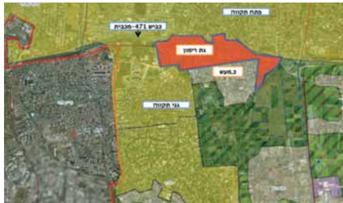
מתחם גת רימון, כפר מעש