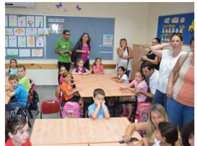
תמונות מהיום הראשון ללימודים בבתי הספר והגנים במועצה