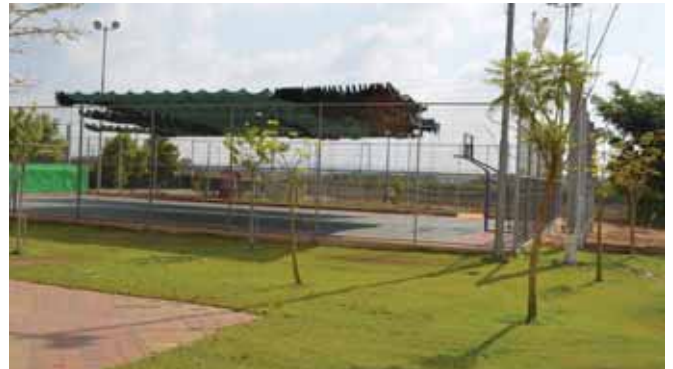
הצללת מגרש הספורט באהרונוביץ

בבית חינוך מתן , הפכו שתיים מכיתות החטיבה הצעירה לסטודיו לאומנות שימש את תלמידי בית הספר. בנוסף, הונגשה אחת