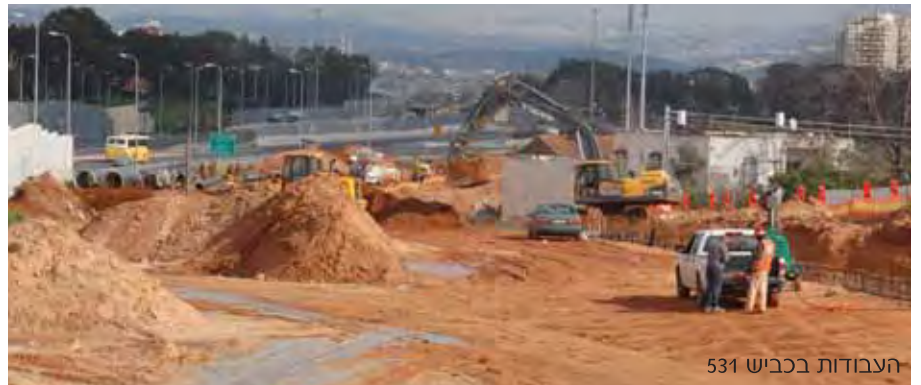
העבודות בכביש 531

ואורכו הכולל של הכביש, כ-17 קילומטרים ומהירות הנסיעה המתוכננת, 110 קמ"ש. לרוחבו יסללו בין ארבעה לשישה נתיבי נסיעה, 8 מחלפים יוקמו לאורכו ועשרות גשרים ומנהרות. לצד הכביש החדש תפעל רכבת פרברית חדשה, אשר תפקוד שתי תחנות רכבת חדשות. מסילת השרון תתחבר לרשת מסילות הרכבת הארצית דרך מסילת החוף (ת"א-חיפה) ותאפשר לתושבי השרון הגעה מהירה לתל אביב גם ברכבת. פרויקט 531 משלב בתוכו קטעים מפרויקט הרכבת הקלה - מערכת הסעת המונים של השרון (BRT).