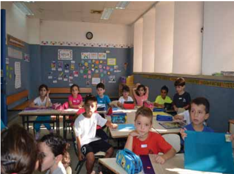
תלמידי כיתות א' בבית חינוך מתן

עם פתיחת שנה"ל התשע"ד לומדים במערכת החינוך של המועצה 6,976 תלמידים מתוכם 1,740 ילדים ב- 57 גני ילדים, 2,985 תלמידים בשבעה בתי ספר יסודיים, 1,386 תלמידים בבית הספר השש שנתי עמי אסף ו-881 תלמידים בבית חינוך ירקון.