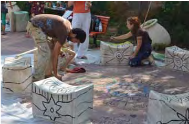
שיפוצי קיץ בבית חינוך מתן

מכיתות בית הספר כך שתתאים לצרכיה של תלמידה כבדת שמיעה. בבית הספר אהרונוביץ נבנתה הצללה מעל מגרש הספורט ושביל הגישה לבית הספר הוצלל אף הוא. בבית ספר צופית שודרג מגרש הכדורסל, שוחזר מגרש כדורעף חופים והותקן מתקן משחקים חדש. בכל בתי הספר למעט החדשים - צור יצחק, אהרונוביץ וירקון בהם מתקני הספורט עומדים בתקני הספורט, הוחלפו כל מתקני הספורט כדי שיעמדו בתקני הבטיחות המתעדכנים כל העת. בבית הספר השש שנתי עמי אסף שודרגו כל תאי השירותים, האסלות הוחלפו והרצפה חופתה בקרמיקה.