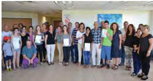
מצטייני "ירקון" (בתמונה העליונה) ו"עמיאסף" (בתמונה התחתונה) עם ראש המועצה, ההורים והצוות המקצועי.

12 תלמידים מצטיינים מביה"ס עמיאסף ובית חינוך ירקון זכו במלגת הצטיינות של המועצה לשנה"ל התשע"ד.