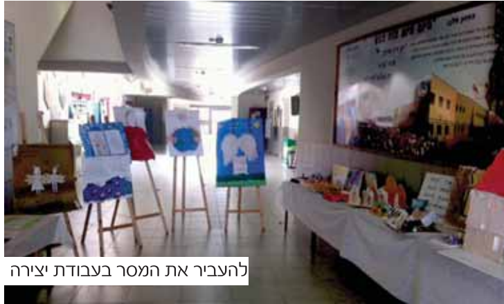
להעביר את המסר בעבודת יצירה