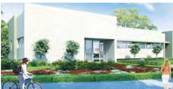
מועדון נוער בצופית - הדמייה

בצופית עתיד להיבנות מועדון נוער חדש בסמוך למועדון התרבות של המושב. המבנה החדש יכלול שלוש כיתות, מחסן, חדר צוות ומשרד בשטח של כ- 210 מ"ר. עלות הפרויקט כ- מיליון שלוש מאות אלף ש"ח והוא ימומן על ידי המועצה האזורית מתב"ר ייעודי והישוב. בימים אלו עומד הפרויקט לפני הגשה לקבלת היתרי בנייה.