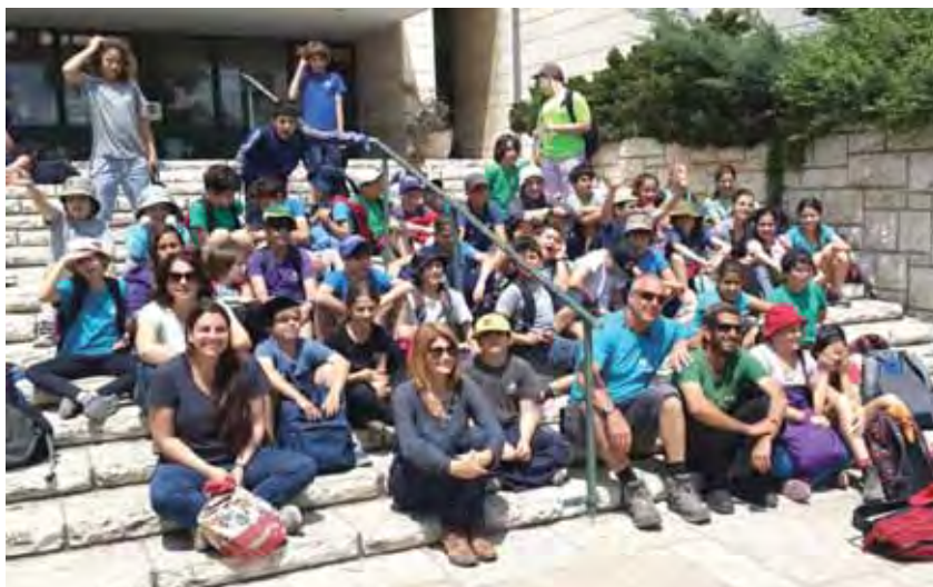
תלמידי “יחדיו” על מדרגות מוזיאון “יד ושם”

תלמידי בית חינוך “יחדיו” יצאו, בהמשך למסורת רבת השנים, אל העיר ירושלים. כל כיתה טיילה במסלול מיוחד שהתאם לגיל התלמידים ולתכנית הלימודים, ומכיוון שהטיול מתקיים כאמור מדי שנה, זוכה כל תלמיד לבקר בכל אתריה המרכזיים של ירושלים ולומד להכיר ולחוות את העיר על כל גווניה, סיפוריה ונופיה המיוחדים. במהלך הטיולים פוגשים התלמידים את נופי העיר, שומעים על ההיסטוריה שלה מתקופת