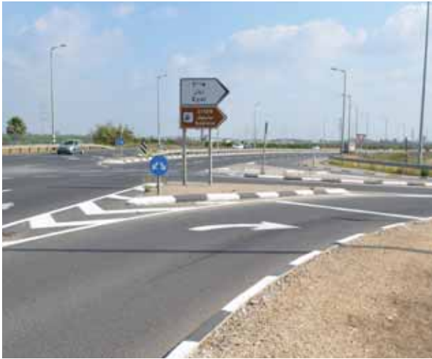
צומת הכניסה הישן שיבוטל

קיבוץ אייל צפוי להתחדש עם צומת כניסה חדש שיסית את הכניסה הקיימת אל הקיבוץ דרומה אל צומת אייל המרומזר. בניית צומת הכניסה החדש אושרה בוועדה המקומית לתכנון ובנייה והוא הוגש לאישור הוועדה המחוזית. בניית הכניסה תעשה באחריות היישוב כדי לתת מענה לבעיה בטיחותית בכניסה וביציאה מהקיבוץ ותוכננה בהתאם לתכנון העתידי של הקיבוץ.