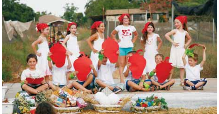
בתמונה: ילדי גן חיים בטקס שבועות.

בישובים רבים במועצה חגגו את חג השבועות בטקסים יישוביים מרהיבים שכללו תהלוכת עגלות, תצוגת טרקטורים, פינות יצירה וכמובן שולחנות עם כיבוד חלבי. חג שמח!