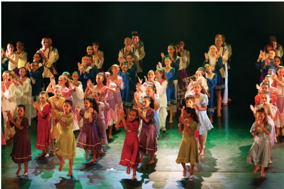
להקת המחול הצעירה - דרום השרון

❖ סל תרבות עבור תלמידי בתי הספר היסודיים והעל יסודיים - בשיתוף ובסבסוד סל תרבות ארצי.