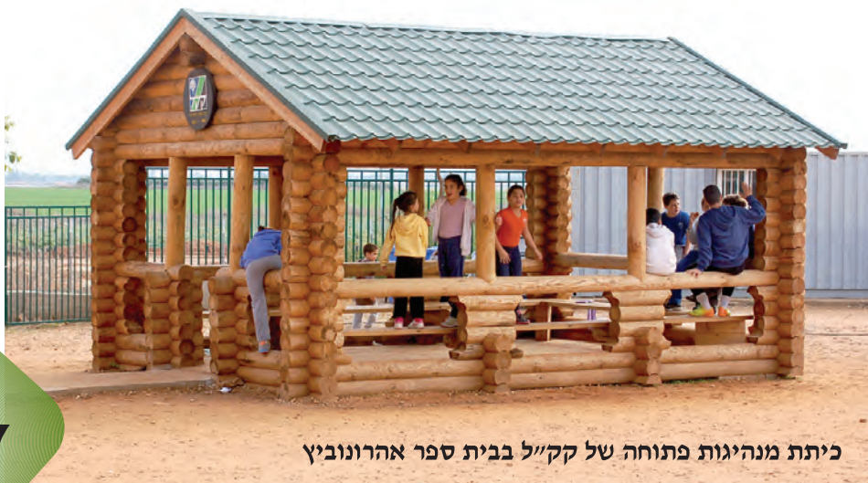
כיתת מנהיגות פתוחה של ק"ל בבית ספר אהרונוביץ

המחלקה המוניציפאלית מתפקדת כחוליה המקשרת בין תושבי המועצה לגורמי המועצה השונים ומרכזת את הטיפול במתן שירותים מוניציפאליים שאינם מצויים בתחום מחלקות המועצה. בין יתר תפקידי המחלקה מצויים הטיפול בשירותי דת, בשירותים לשעת חירום, נושאים חקלאיים, תחבורה ציבורית וריכוז בנושא התיירות הכפרית. המחלקה המוניציפאלית מרכזת את הבקרה והביקורת על פעילותם של הועדים המקומיים. בעקבות התיקון לצו המועצות המקומיות (מועצות אזוריות) התשי"ח 1958 מחוייבים הועדים המקומיים בהגשת דוחות כספיים ודוחות ביקורת לעיונה ואישורה של המועצה האזורית.