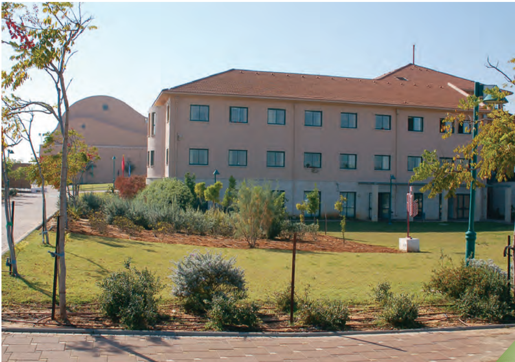
בית המועצה האזורית

התקציב הוא המסגרת הכלכלית לפעילותה של הרשות, ומהווה כלי לניהול הרשות על פי מטרות ויעדים. התקציב משקף תמונת מצב של מבנה הרשות, מספר עובדיה, תפקידיה השונים והאופן שבו היא מבצעת אותם. התקציב הוא גם הצהרת הכוונות של הרשות והעומד בראשה, לגבי תוכניות העבודה וסדרי העדיפויות שלה בשנת התקציב, בהתבסס על אומדן הכנסות והוצאות ומתוך שאיפה לאיזון, כלומר שסך ההוצאות לא יעלה על סך כל ההכנסות. עבודה על פי תקציב מהווה מסגרת כספית מחייבת לכל פעולה שעושה הרשות, מבטיחה מימון נאות לפעולות אלו, מעודדת חסכון והקפדה על ביצוע יעיל של הפעולות, ומהווה מסגרת לבקרה, פיקוח וניתוח של חריגות.