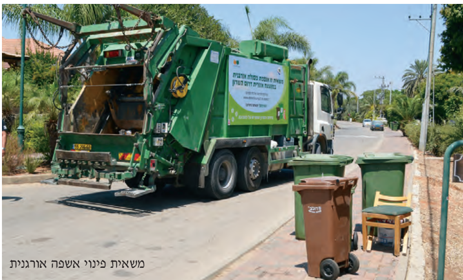
משאית פינוי אשפה אורגנית

● טוואי התהלוכה - הדברת טוואי התהלוכה בעצי האורן שבשטחי היישובים על ידי הזרקה ישירה של חומר קוטל לגזעי העצים. מתבצע מדי שנה בחודשים דצמבר - ינואר. ● הדברה במוסדות חינוך - לקראת פתיחת שנת הלימודים מתבצעת בחודשי הקיץ הדברת מזיקים בכל מוסדות החינוך של המועצה. במידת הצורך מתבצעת גם הדברה כנגד מכרסמים. ● הדברת יתושים - המועצה חברה ב"איגוד ערים לתברואה" (הדברת יתושים). הפעילות נערכת בכל ימות השנה בהתאם לניטור ולדרישת המועצה. הגישה העקרונית בלחימה ביתושים היא טיפול מונע, כלומר יצירת תנאים בלתי מתאימים להתפתחות זחלי יתושים במקומות דגירה פוטנציאליים. האיגוד מבצע עבודות ריסוס נגד יתושים וריסוס עשבייה בערוצי מים, מאגרים, בריכות חמצון וכד'.