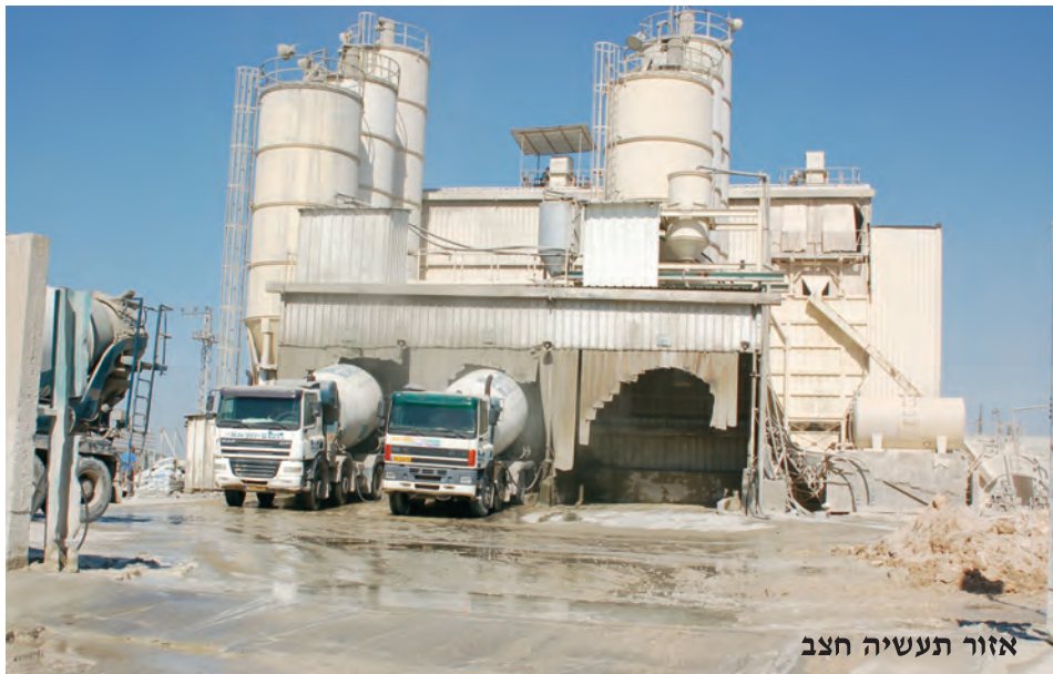
אזור תעשייה חצב